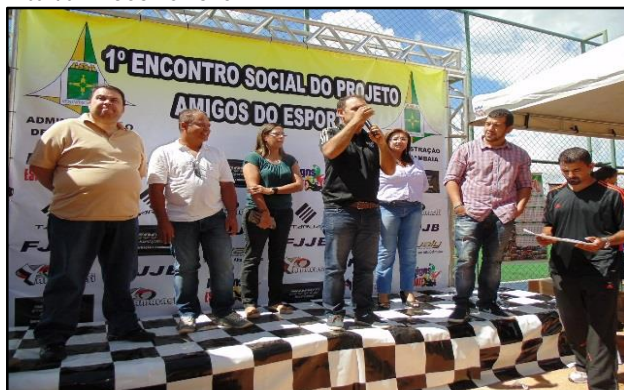
Encontro AMIGOS DO ESPORTE