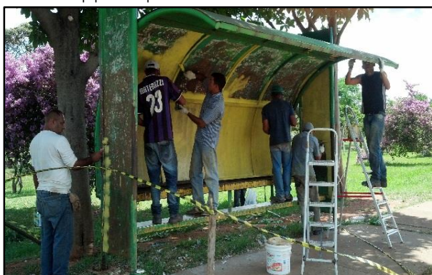
Reforma de equipamento público