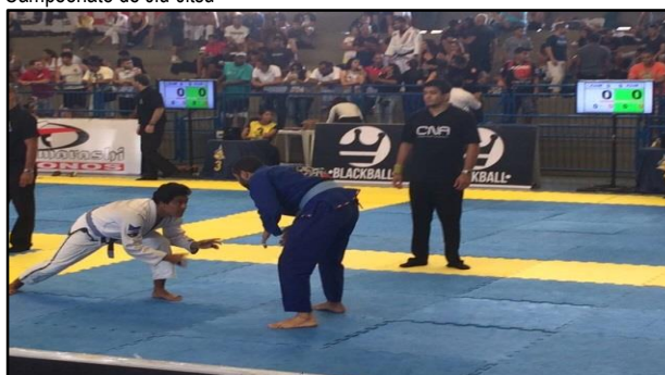
Campeonato de Jiu-Jitsu

Abaixo encontram-se fotos representativas do evento: