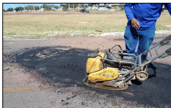
Operação de tapa-buraco