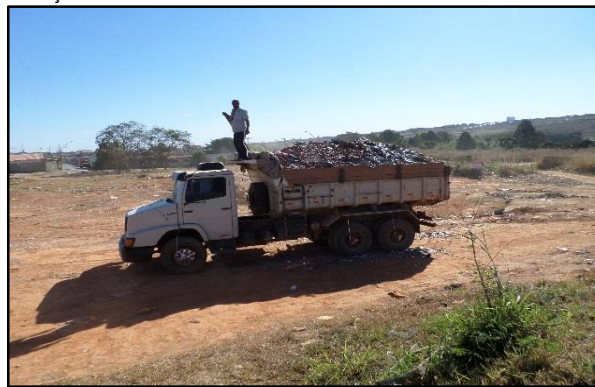
Remoção de Entulho