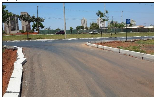
Reposição de meios-fios