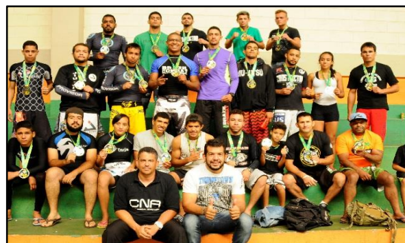
Campeonato de Jiu-Jitsu