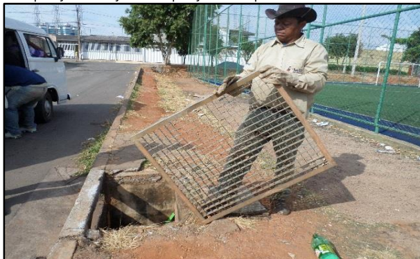
Recuperação de calçada e Reposição de tampa de PV