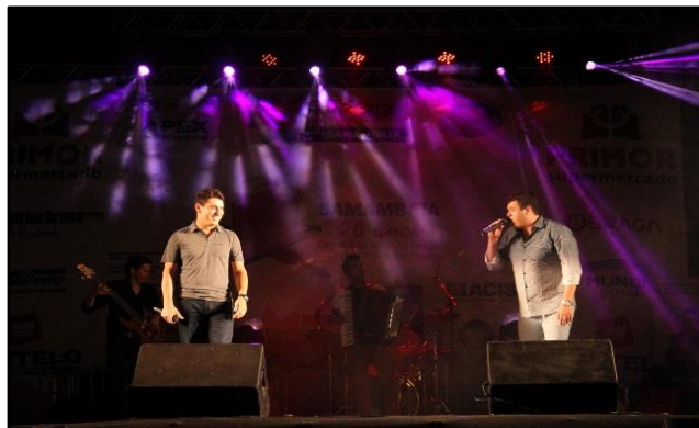
Bone e Beluco

Abaixo encontram-se algumas imagens que corroboram a ocorrência dos eventos: